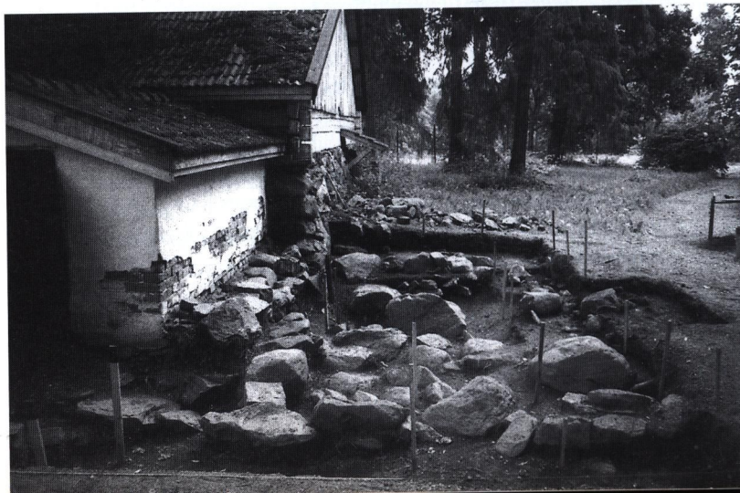
Bild 1. Laukko, den medeltida källarens södra del sedd från väster. I förgrunden t.v. ett senare annex för källartrappan. Söder om källaren utgrävningsområdet för åren 1996-97. Platsen för myntfyndet ligger mellan de tre större stenarna, som syns vid utvidningsschaktet av utgrävningsområdets sydgräns (t.h.).

Trots de tidigare gjorda antagandena om möjliga under markytan liggande murar av ett medeltida "stenslott" har tills vidare inga sådana påträffats. Men under ut-